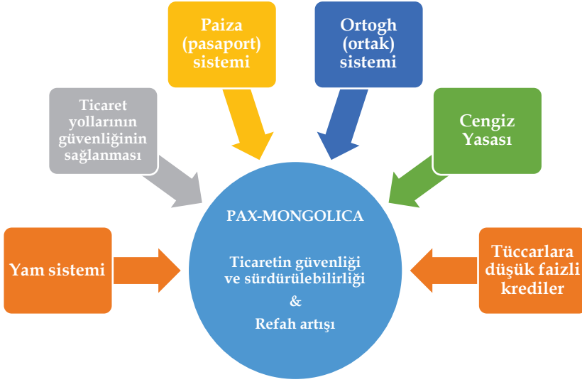
Şekil 1. Ticaretin güvenliği ve sürdürülebilirliği için uygulanan politikalar

faaliyetlerin devamını sağlamada önemli faktörler olarak sıralanabilir. Cengiz Han'ın sağlamış olduğu bu istikrar tüccarları da memnun etmiştir. Hatta fetihler ile zenginleşen Moğollar bu tüccarların yeni müşterileri olmuştur. 28 Cengiz Han'ın fetihleri ve sağladığı güvenlik ortamı Doğu ve Batı arasındaki ticareti büyük ölçüde arttırarak halklar arası iletişim ve kültür koridoru da açmıştır. 29