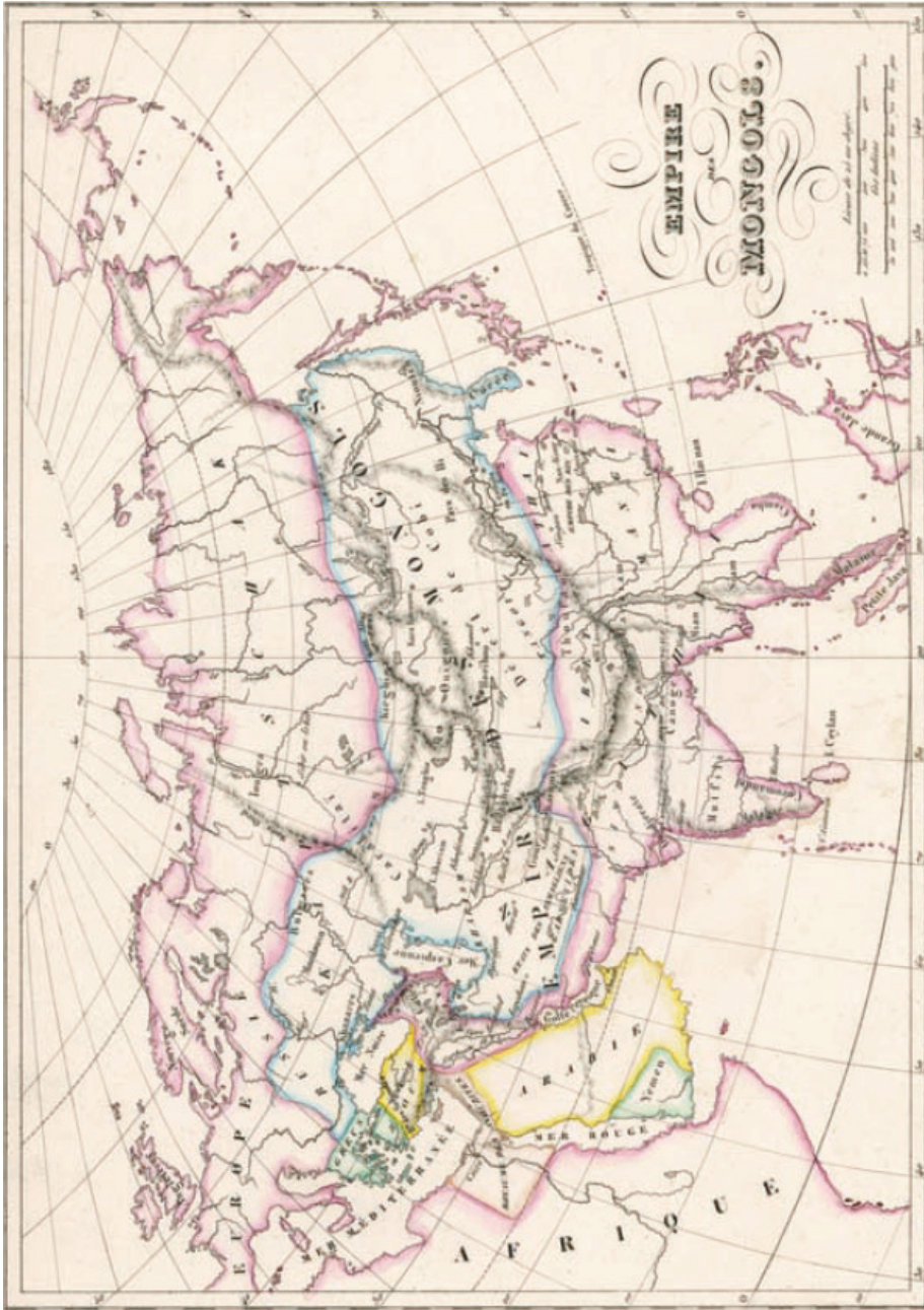
Harita 1. Cengiz Han'ın yönetiminde XIII. yüzyılda Moğol İmparatorluğu'nun bir haritası. 4